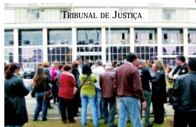
TRIBUNAL DE JUSTIÇA