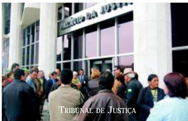
TRIBUNAL DE JUSTIÇA