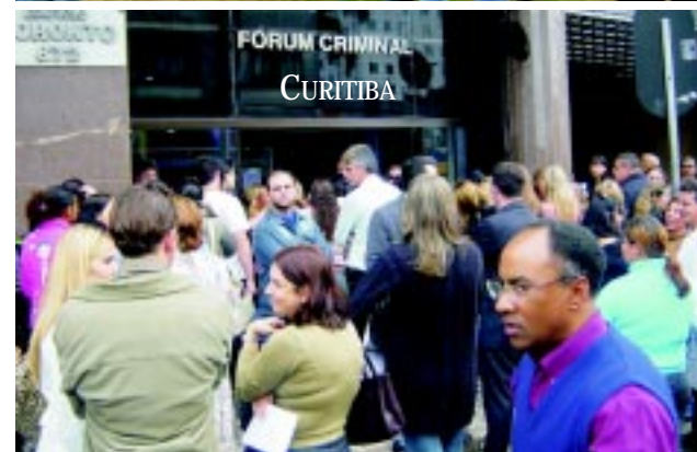
FÓRUM CRIMINAL CURITIBA