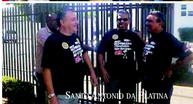
SANTO ANTONIO DA PLATINA