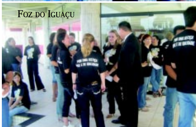
FOZ DO IGUAÇU